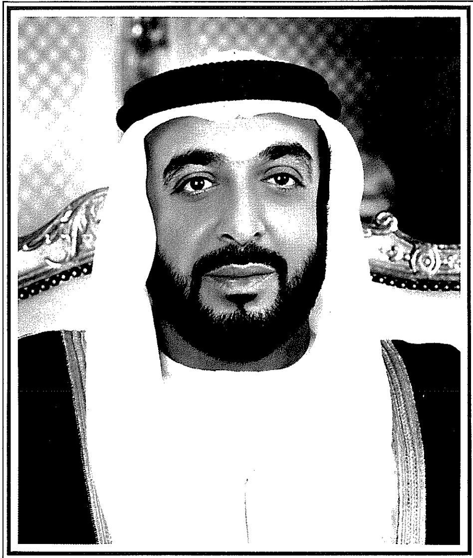
His Highness Sheikh Khalifa Bin Zayed Al Nahyan Crown Prince of Abu Dhabi, Deputy Supreme Commander of the Armed Forces