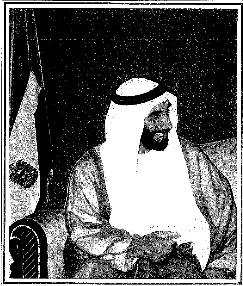
His Highness Sheikh Zayed Bin Sultan Al Nahyan President of the United Arab Emirates and Ruler of Abu Dhabi